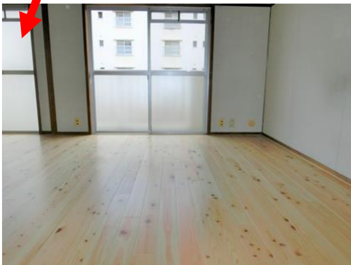
洋室 (リビング・ダイニング)

床は県産木材を使っています！ また、台所と洋室の間仕切りを取り払い、 広い空間として利用できます。