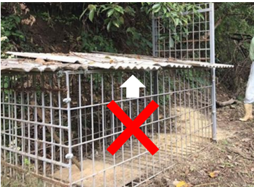
↑天面に雨避けを使った箱わな

米ヌカなどの撒き餌が雨で痛まないように天面に板を置いてあると、上記同様イノシシが警戒してしまい、捕獲率が低下します。