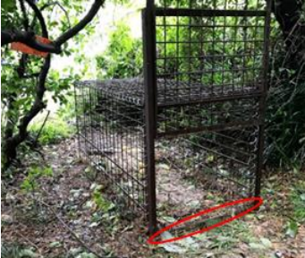
↑入り口の段差をなくした箱わな

イノシシは蹄にもものが挟まることを嫌いますので、箱わなの底面が見えないよう、土で覆い固定しましょう。