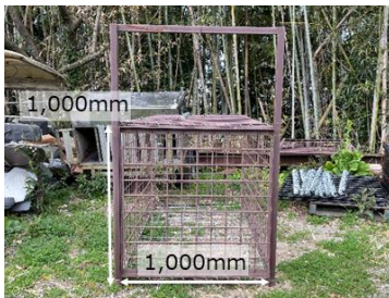
箱わなの規格（高さ、幅）