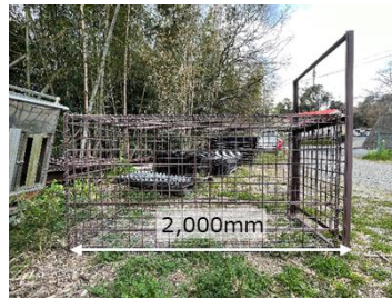
箱わなの規格（奥行）