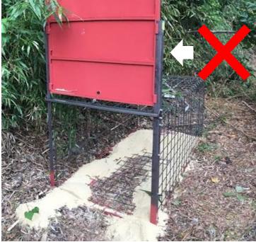
↑扉に鉄板を使った箱わな

箱わなの扉が鉄板で作られている場合、先が見えないことで警戒し、近づこうとしなくなります。