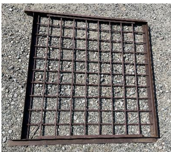
実際の扉（格子の目：1辺100mm）