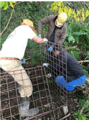
↑実際に組み立てているところ