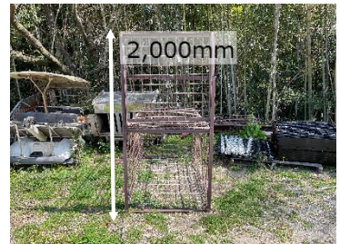
箱わなの規格（扉を開けた時の高さ）