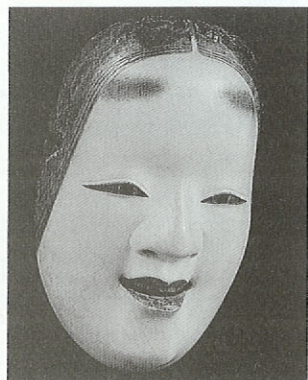
松井文庫名品展III 能面(小面)