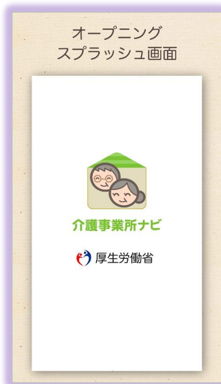
厚生労働省のクレジット