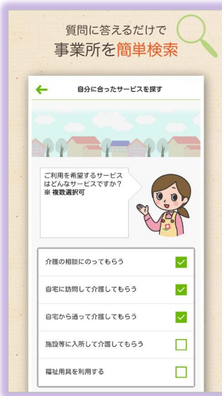
介護サービスに詳しくない方には質問形式で誘導