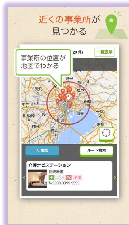
現在地からの距離や道順が分かる