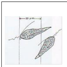
シャットネラ属プラナクトン

シャットネラ属は有害で、魚類や貝類などをへい死させる恐れがありますので、周辺海域で養殖・蓄養をされている場合は、海の色の変化や養殖魚等の状態に注意してください。