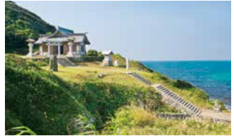
C 宗像大社沖津宮遙拝所