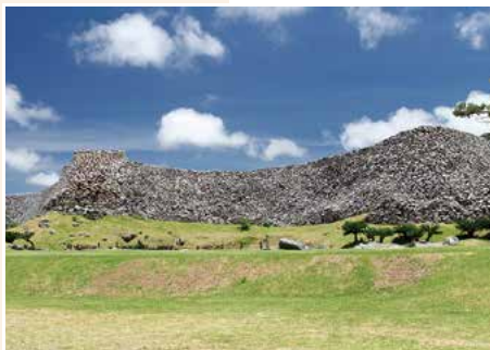
今帰仁城跡 沖縄本島北部を治めていた王が住んでいた城