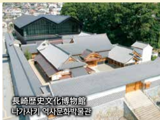
長崎歴史文化博物館 나가사키 역사문화박물관