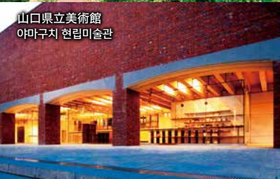
山口県立美術館 야마구치 현립미술관