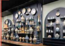
蒲原コレクション(有田町所蔵)