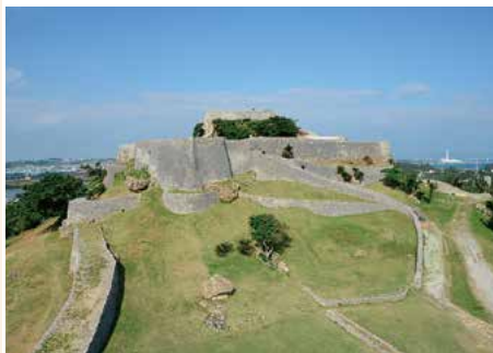
勝連城跡 勝連城主阿麻和利が住んでいた城