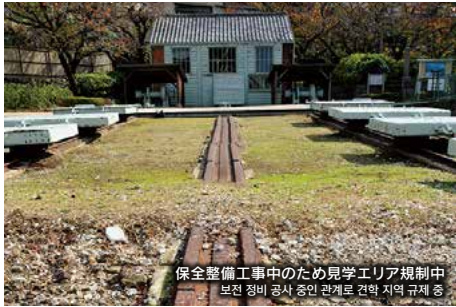
保全整備工事中のため見学エリア規制中 보전 정비 공사 중인 관계로 견학 지역 규제 중

小管修船場跡 蒸氣機関を動力とする曳揚げ装置を備えたスリップドック 【所在地】長崎県長崎市小管町5 【連絡先】095-822-8888(長崎市コールセンターあじさいコール)