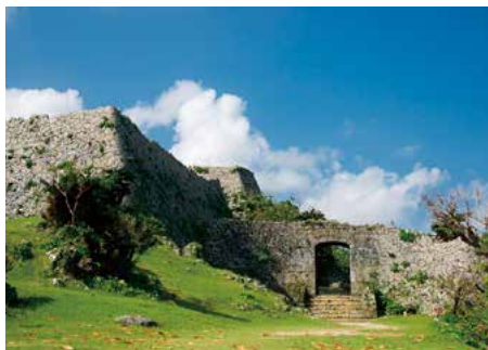
中城城跡 護佐丸が勝連城主の攻撃に備え築城した城