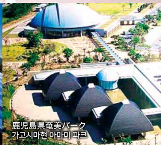
鹿児島県奄美パーク 가고시마현 아미미 파크