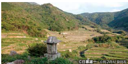
春日集落と安満岳 가스가 마을과 야스만다케

【소재지】 구마모토현 아마쿠사시 가와우라마치 사키쓰 463(사키쓰 자료관 미나토야) 【연락처】 0969-75-9911