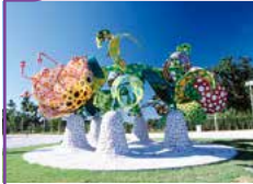
シャングリラの華(草間彌生)