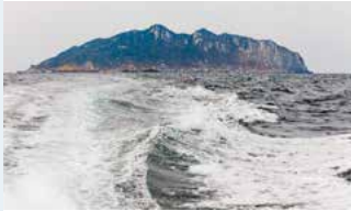
A 宗像大社沖津宮 (沖ノ島、小屋島、御門柱、天狗岩) 古代祭祀遺跡を起源とした、今日も信仰の対象である神宿る島 ※宗像大社の神籬以外は原則立入禁止

무나카타타이샤 오키쓰미야(오키노시마, 고야지마, 미카도바시라, 텐구이와)