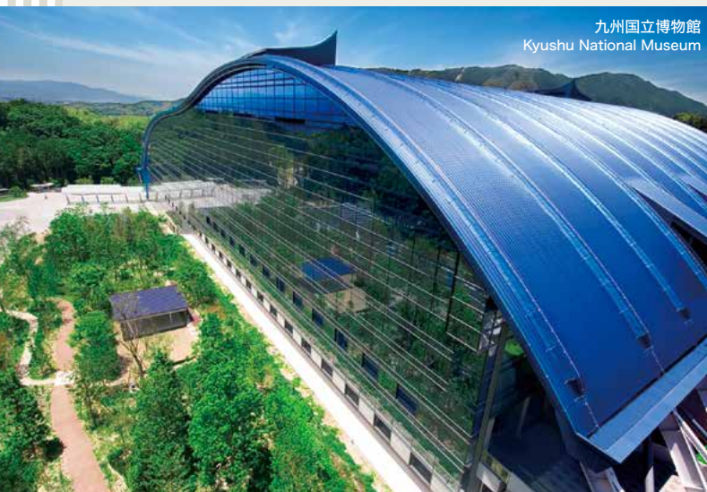
九州国立博物館 Kyushu National Museum