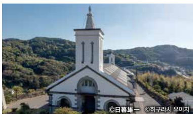
외해의 시쓰 마을

【연락처】 0950-22-7020(가스가 마을 거점 시설「가타리나」히라도시 가스가초166-1), 0950-53-3000(히라도시 이키쓰키박물관「시마노야카타」이키쓰키초 미나미엔 4289-1)