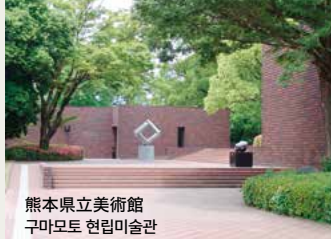
熊本県立美術館 구마모토 현립미술관