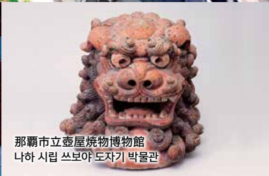
那覇市立壺屋焼物博物館 나하 시립 쓰보야 도자기 박물관