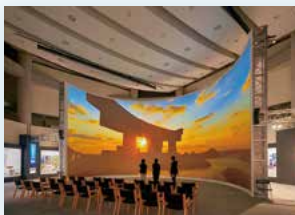
F 世界遺産ガイド施設 海のむなかた館