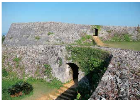
座喜味城跡 護佐丸が15世紀前半に造った城