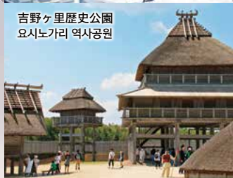
吉野ヶ里歴史公園 요시노가리 역사공원