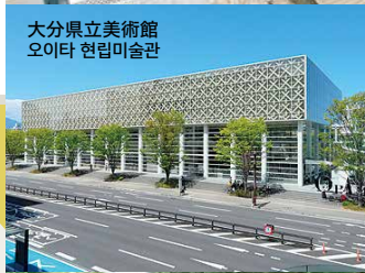
大分県立美術館 오이타 현립미술관