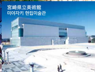
宮崎県立美術館 미야자키 현립미술관