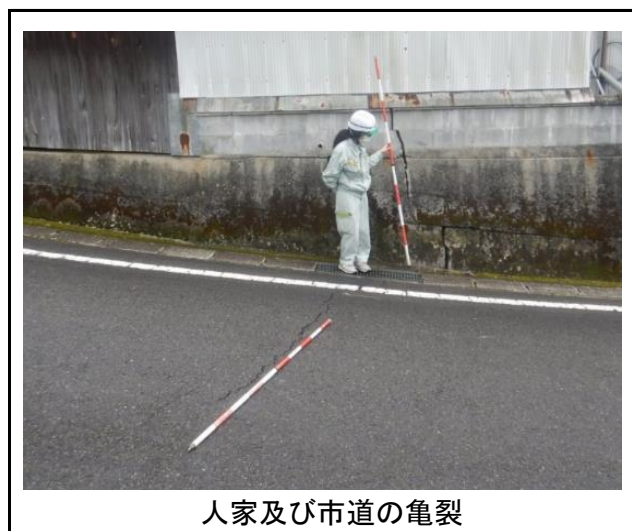
人家及び市道の亀裂