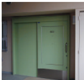
引き戸の出入り口