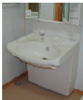
高さの調整ができる洗面台