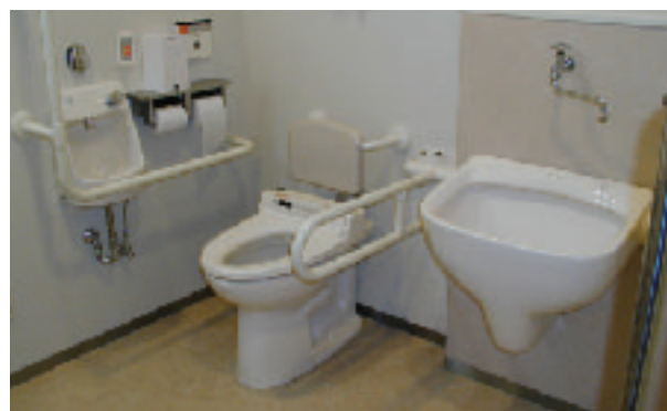
サントリー九州熊本工場