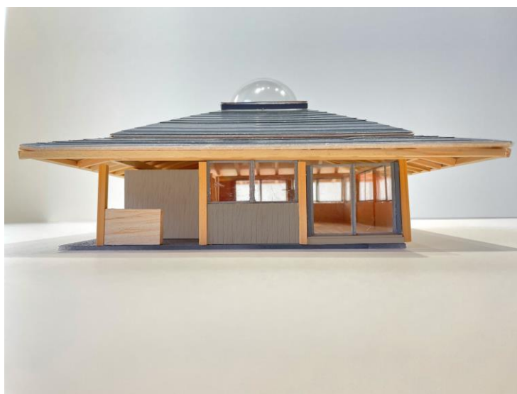
八代市中津道のみんなの家／イメージ模型写真（西立面）