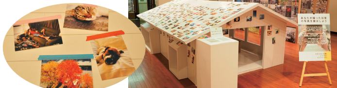
この「みんなの家」は中に入って楽しめるようになっている

「みんなの家」をモチーフに制作した「参加型の展示物」を設置した。県内外の来場者らが持ち寄った写真を展示物の屋根や壁に貼り、日常の生活の大切さを伝える作品としてつくりあげた。会期中、東日本大震災で被災した福島県新地町からも写真が届き、400枚以上の写真が敷き詰められた。