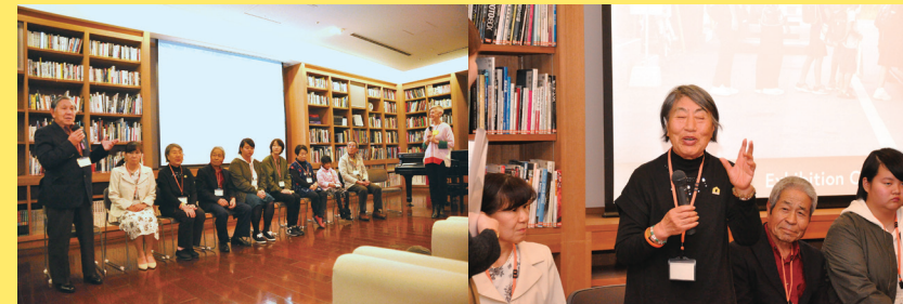
展覧会セレモニーの様子