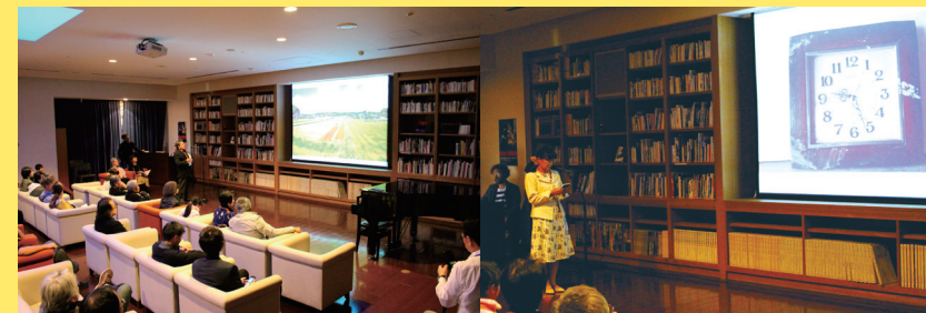
ペチャクチャイベントの様子