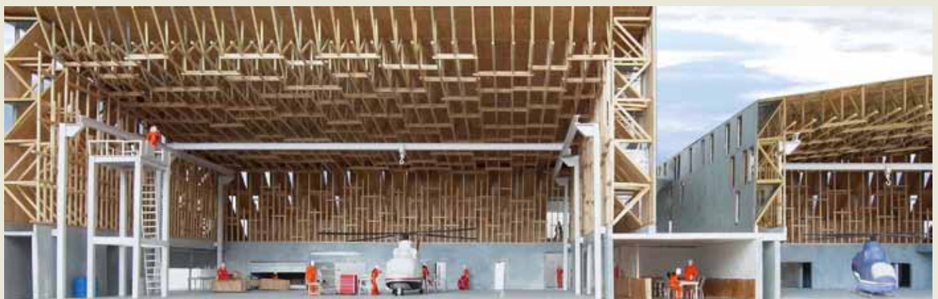
内観模型写真(格納庫)

構造、ボリュームの操作、プランニング、すべてにおいてデザイン性と機能性とのバランスがとれていることが高く評価された。空港の一角にこの建築が置かれたときの「たたずまい」が周囲の風景にじっくりくる。また、勾配のある屋根は非常に良い景観をもたらすであろう。若干気になるのは、開口部のつくり方がややデザイン性を過剰に意識されていた点。運行管理室と防災消防航空隊事務室の空間連携に関しては修正が必要であるのではという点に関しては現プランニングの延長上で再配置可能であると判断。このようなことが論議対象となったが、総合的に全審査員の賛同を得る高評価を得た。限られた予算の範囲内で、地場産材を活用した木造を取入れ、環境に配慮し機能的で機動的な空間の要求とデザイン性を如何に対応させるか、そのバランスをどのように考えるかが今回の提案で重要なテーマであった。最優秀案は、その兼ね合いが高く評価された。