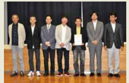
表彰式終了後に記念撮影