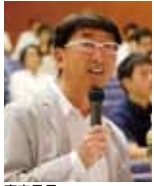
審査員長 伊東 豊雄 くまもとアートポリス コミッショナー