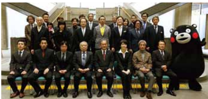
受賞者・関係者とくまモンで記念撮影

豊前街道で「一番危うい」と言われていた倒壊寸前の建物であり、間口に壁が一つもない中、特殊な構造をもって何とか再生することができました。百年後まで残るように、という施主様の想いが実現出来たと思います。