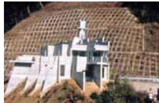
石打ダム管理所(宇城市) 設計/青木茂

建物が教材となるよう、トラス梁はもちろんその他の構造材が内部からみえるようになっている。