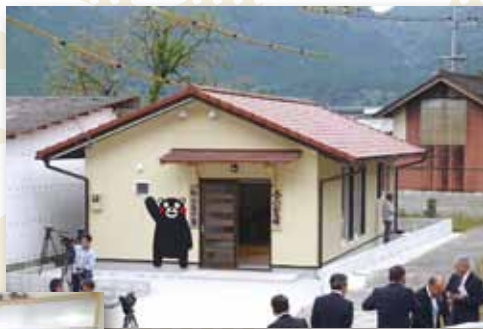
高田住宅みんなの家は 土井地区の(古城5-1区)「公民館」として移設