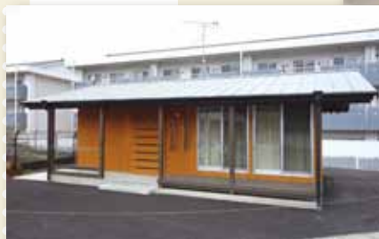
池尻・東池尻住宅みんなの家は 阿蘇市営池尻住宅の「集会所」として移設