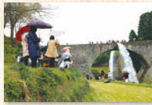
豪快な放水も見物

次に向かったのは山都町の通潤橋。多くの見学者とともに放水の瞬間をカウンタダウン。迫力満点の姿に歓声があがった。橋の