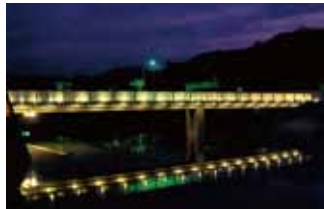
湯の香橋(葦北郡芦北町) 設計/岸和郎

アートポリス参加第1号プロジェクト。正面はすべてハーフミラーを採用、上層部分には柔剣道場やギャラリーが配置されており上に行くほど広がる構造が特徴的。