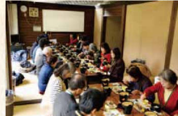
昼食会場の佐俣の湯(美里町)

上から下から素晴らしい石組みアーチの造形美を楽しみ、熊本の風土の豊さに改めて感銘を受けた様子。