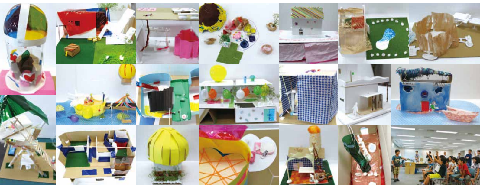
こども建築塾作品