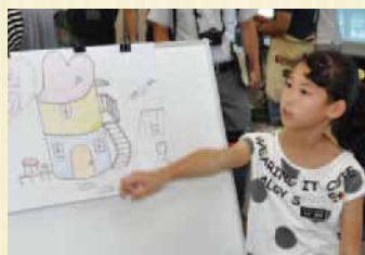
私の好きなハート形の屋根にしました!