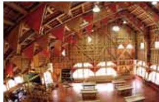
球磨工業高校伝統建築コース 加工組立室棟(人吉市) 設計/象設計集団

橋のデザインとして照明効果を考慮し、橋の下の水面に光が廻るように計画されている。夕暮れの散歩も楽しめる。