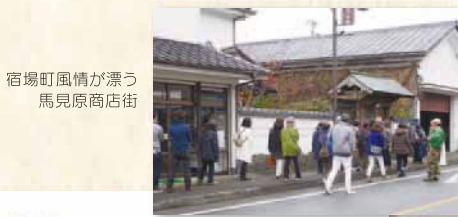
宿場町風情が漂う馬見原商店街