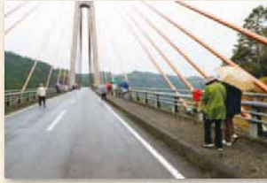
溪谷を跨ぐ美しい鮎の瀬大橋(山都町)

タリックオレンジのケーブル、視線を下した先には溪谷の美しい風景が広がる情景に「設計者の力に感動した」との声。橋のもとにある「鮎の瀬交流館」で地元の新鮮な野菜や米・加工品などの買い物も楽しんだ。