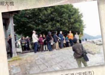
明治の石積みが残る三角西港(宇城市)