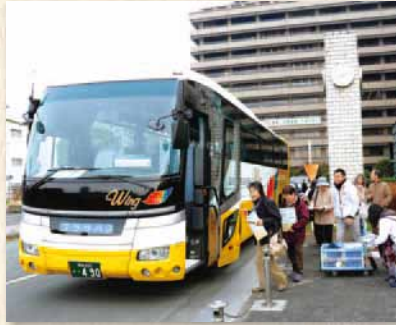
県庁に集合し大型バスで出発

当日はあいにくの雨模様。県内39名の参加者が県庁を出発。まず向かったのは世界文化遺産に登録された三角西港。案内ボランティアの方からの説明を聞きながら100年以上前に築かれた岸壁や石造りの水路、ムルドルハウスなど、当時の最新の技術を用いて造られた近代的な港湾都市を見学した。