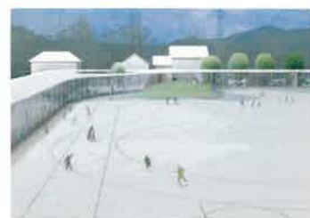
ヨコミゾ・山中・小野田共同設計企業体 横溝真氏(東京都)

学校というのは、建物がいいから素晴らしいというわけではない。あくまでも子どもたちが生き生きして元気の良い学校がいい学校。そのための支援としてこの学校の設計を考え、雑木林の木陰に教室が滑り込んだような限りなく外に近い伸びやかな学校をイメージし、L型の壁をもつ教室で構成されるオープンスクールを進化させた全く新しい「宇土タイプ」を提案したい。