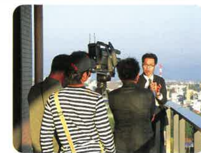
韓国主要テレビ局の取材の様相