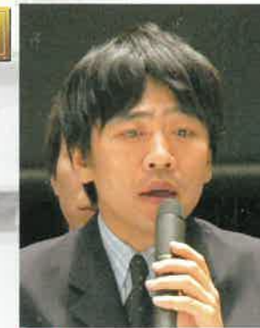
西沢立衛氏 西沢立衛建築設計事務所(東京都)

熊本の気候は日差しが強く雨も強い。そこで、屋根を駅前広場にかけることで快適でさわやかな空間を作りつつ、ゆったりと青空に浮かぶ「大きな雲」のようなものを熊本の新しい玄関口として考えた。各々の屋根は機能的な部分を覆い独立した用途・機能を持ちながらも広場空間は全体として連続し、人々の憩いの場所あるいは小さな公園のようなパブリックスペースとすることで、車や人だけでなく、ストリートパフォーマンスやストリートファニチャー、緑などが緩やかに融合する空間となる。床面は段差を設けず、全体として連続したフラットな空間としたい。