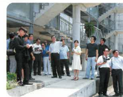
韓国国会公共デザイン文化フォーラム視察団の視察の様相

一方国内では、地元経済誌「くまもと経済」に、くまもとアートポリスの再発見が緊急の課題として取り上げられ、またスカイネットアジア航空の機内誌では特集記事が掲載されるなど、くまもとアートポリスの成果は着実に広がりつつある。