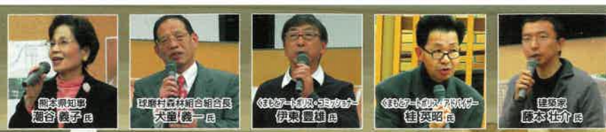
モクバンR2 第3回(最終)公開審査

ここにしか存在しないような建築、これを造りたいんだという気持ち、何のために建築するのかという強い思いが何よりも大切ではないか