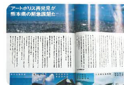
地元経済誌「くまもと経済別冊 ESPRESSO[エスプレッソ] 創刊号」での紹介