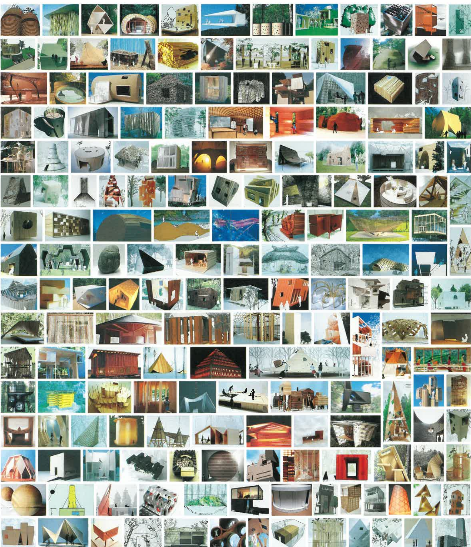
くまもとアートポリス設計競技2007 モクバN2第3回公開審査応募作品(180作品)

●発行 くまもとアートポリス事務局(熊本県土木部建築課内) 〒862-8570 熊本市水前寺6-18-1 TEL096-333-2537 FAX096-384-9820 素敵な建物を建築したいとお考えの市町村や民間企業の皆様。くまもとアートポリスでは国内外から優れた建築家をご紹介しますので、いつでもご相談ください。