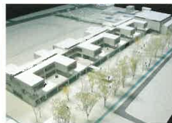
株式会社SDA 建築設計事務所 牧野裕三氏(熊本県)

原っぱの一角に教室をおいたような、低くやわらかく周辺の環境と溶け合う学校をイメージ。すべての子供が自分の居場所を持つすべての学年と交流がもてるような、校庭をやわらかく包み輪っか状の校舎を提案。