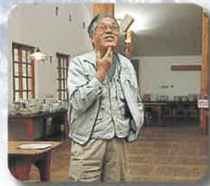
設計者 藤森 照信氏