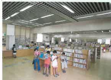
不知火文化プラザの図書館では子どもたちが熱心に読書をする

明治時代から伝わる白壁、港が残る一方で、アートポリス建造物による新しい景観づくりが進む宇土半島。慣れ親しんだ光景を愛し、新しい建物を活かしていこうとするまちと人々を訪ねた。