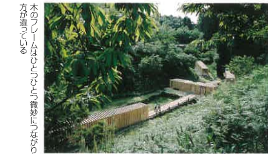
木のフレームは、ささくささく微妙に木が透して見える