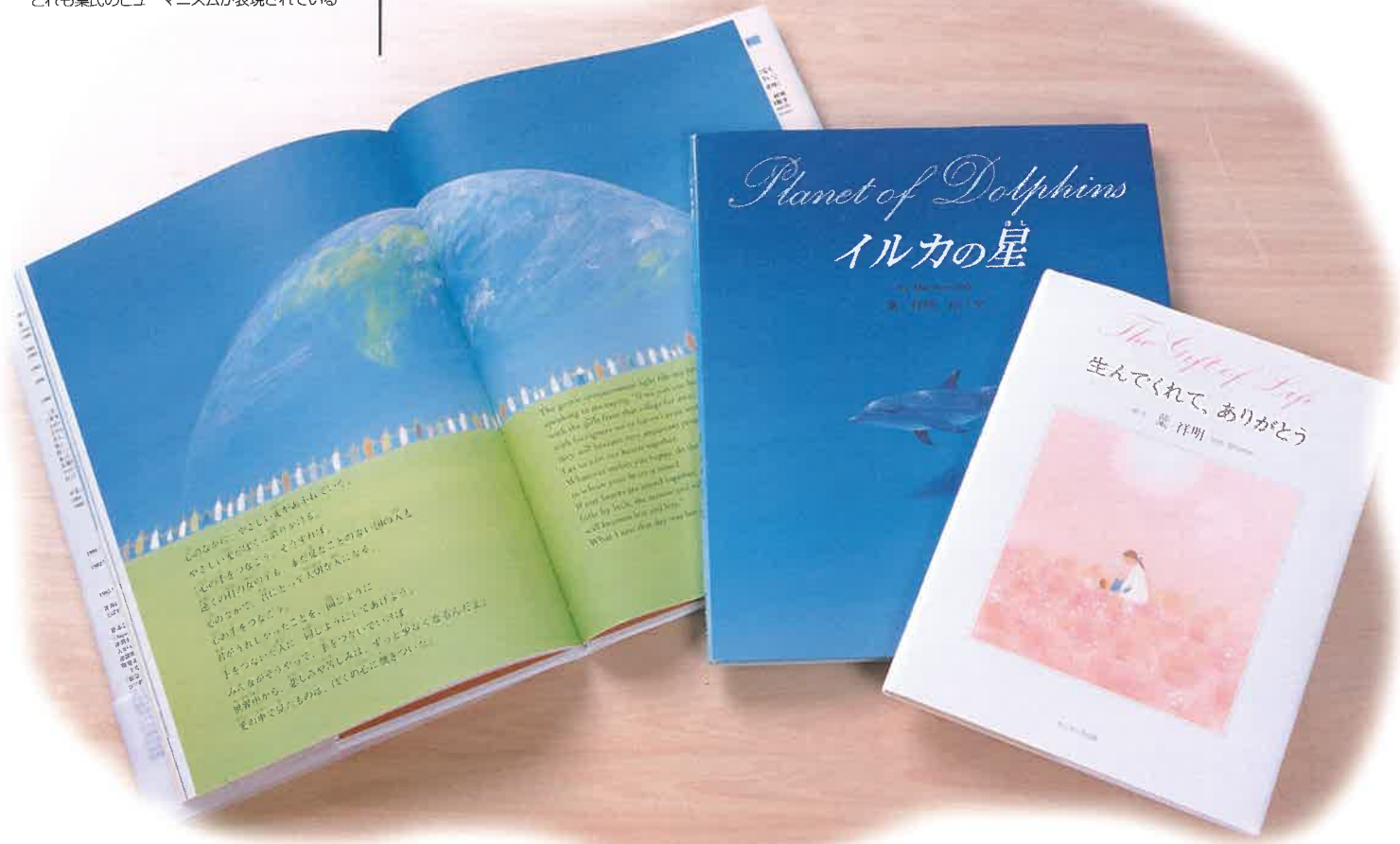
葉さんの近作。作品のテーマは平和、人権などで、どれも葉氏のヒューマンイズムが表現されている

建築は第二の自然といってもいい。 だから風景に美しく溶け込むものであってほしい。