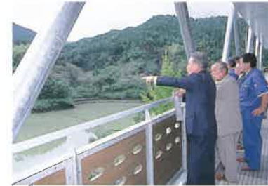
紅葉が有名な泉村だが、このダム周辺は桜も美しい。4月から5月にはこのデッキから見たような新緑を見ることができる