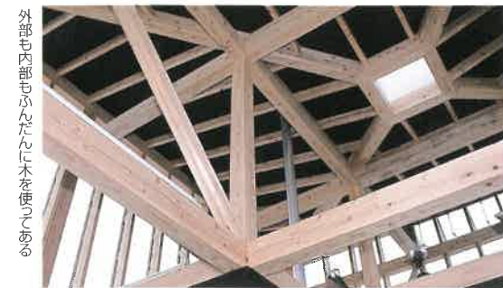
文楽館、物産館と調和したデザイン