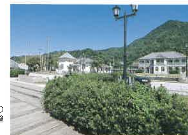
明治時代の趣を残す三角町の西港では、レストランなども整備されている