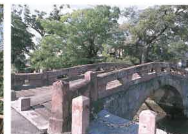
宇土市の景観に自然にけこむ船場橋。馬門石で作られた代表的建造物のひとつだ