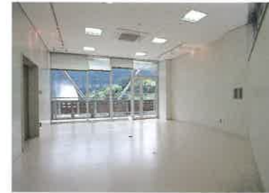
このホールが地域と関わっていく日も遠くない