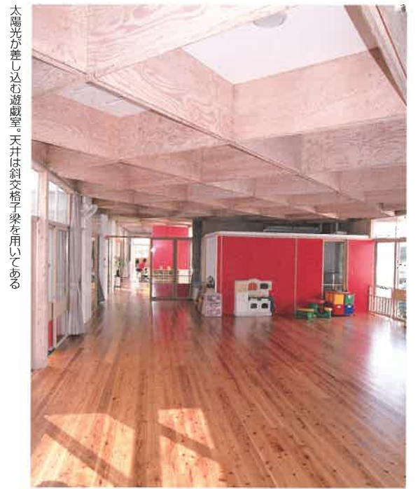
太陽光が差し込む遊戯室。天井は斜交格子梁を用いている

子どもが思いっきり走りまわれる全く段差のない床、廊下から中の様子をうかがえるように窓が付けられた子ども用トイレといった利用者への配慮が随所に見える。また、壁を移動させれば部屋の広さを変える