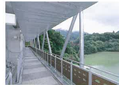
展望デッキは吊り橋のイメージ。湖面に浮かんでいるように見えるデザイン効果がある