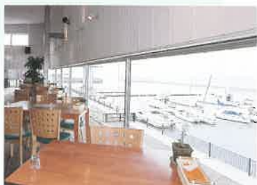
宇土マリーナに5月にオープンしたオーガニックレストランからは、マリーナと有明海が望める