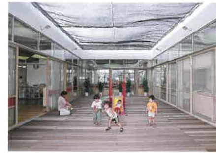
木をふんだんに使った園内は、透明のガラスを通して、太陽の光が入る明るい雰囲気。