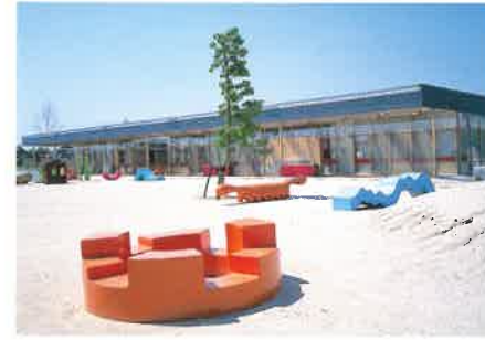
設計者や子どもたちが一緒にデザインした遊具もあふれる。