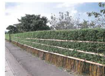
宇土市街の定府地区は、参勤交代の廃止に伴い帰国した藩士の館があった地域。その面影を残す世帯が、伝統的な景観をかもしている