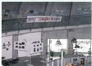
三角町の海の玄関東港にある「海のピラミッド」内部では、地元小学生の絵画展なども行われる