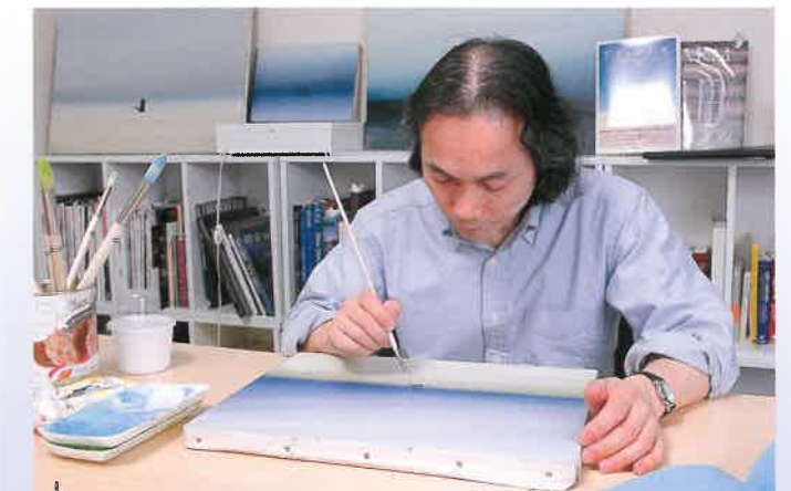
丹念に絵の具を塗り重ね、独特の色あいで風景が描かれる

造形、まち、建築…あらゆるものは他者とともにあるという共存意識をもって、やさしさや穏やかさをもたらすこと。それが表現者の役割ではないでしょうか。